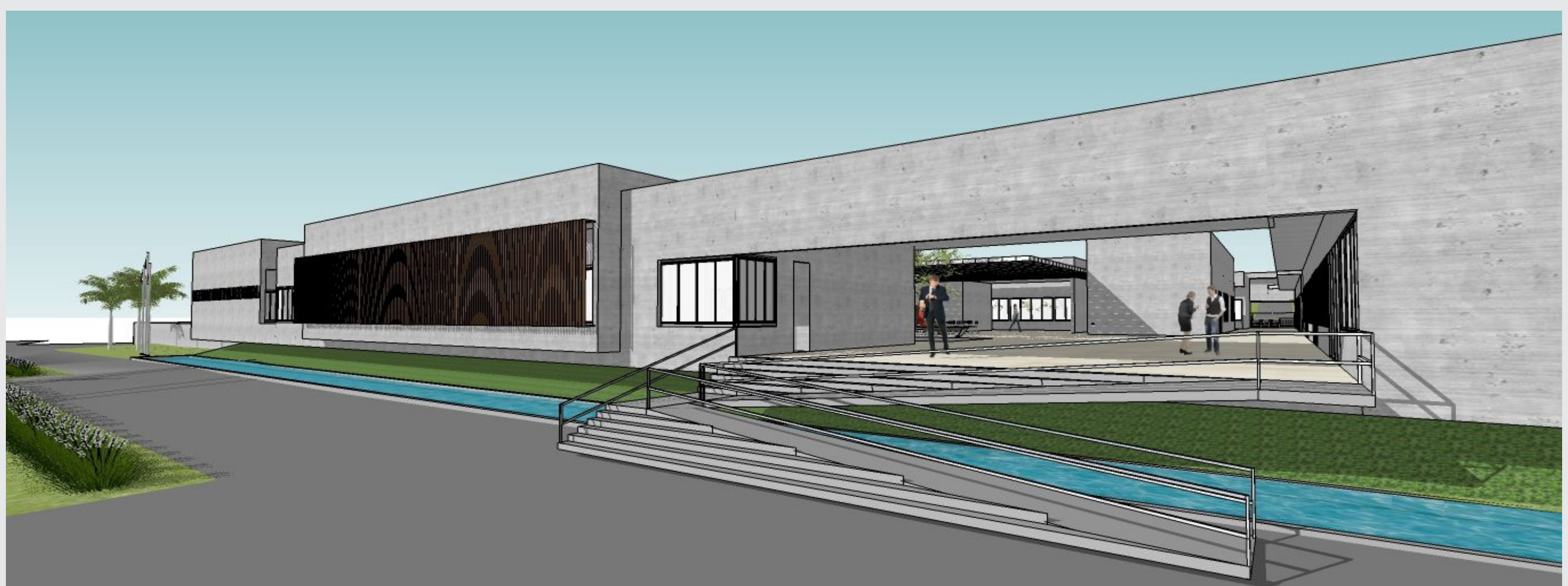
FOTO ILUSTRATIVA MAQUETE ELETRÔNICA

O ESPAÇO FÍSICO DA ORGANIZAÇÃO ADMINISTRATIVA DO PODER EXECUTIVO DE UM MUNICÍPIO INTERFERE DIRETAMENTE NA QUALIDADE DE SERVIÇO PRESTADO E BOM ATENDIMENTO AO USUÁRIO, POR ESSE MOTIVO O ESPAÇO DEVE SER PENSANDO E ESTRUTURADO DE FORMA QUE ATENDA SATISFATORIAMENTE ESSAS DIRETRIZES. SEGUINDO ESSES PRINCÍPIOS PROPÕE-SE A ELABORAÇÃO DE UM PROJETO FUNCIONAL COM INTEGRAÇÃO DO ESPAÇO, FAVORECENDO O CONVÍVIO HUMANO.