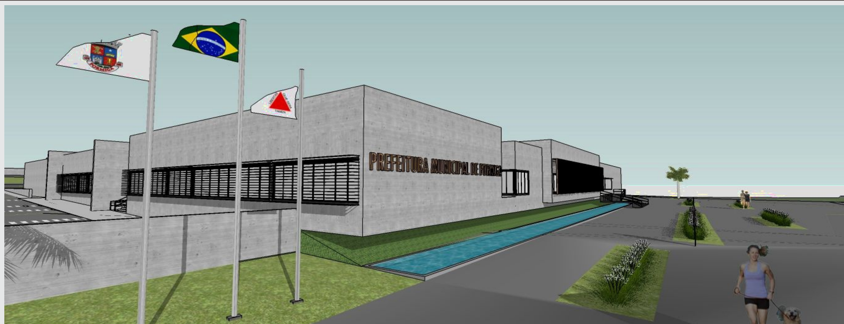
FOTO ILUSTRATIVA MAQUETE ELETRÔNICA