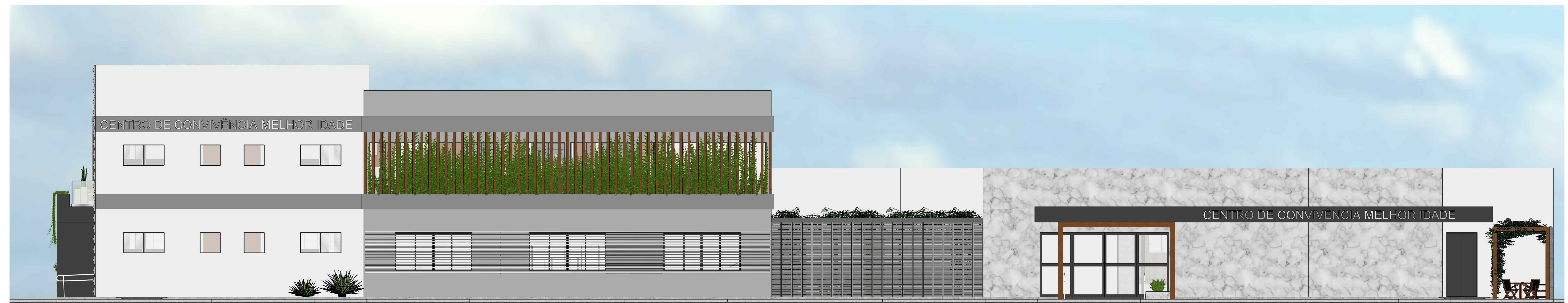
FACHADA FRONTAL - PRINCIPAL (IMAGEM 3D) ESCALA: 1/75