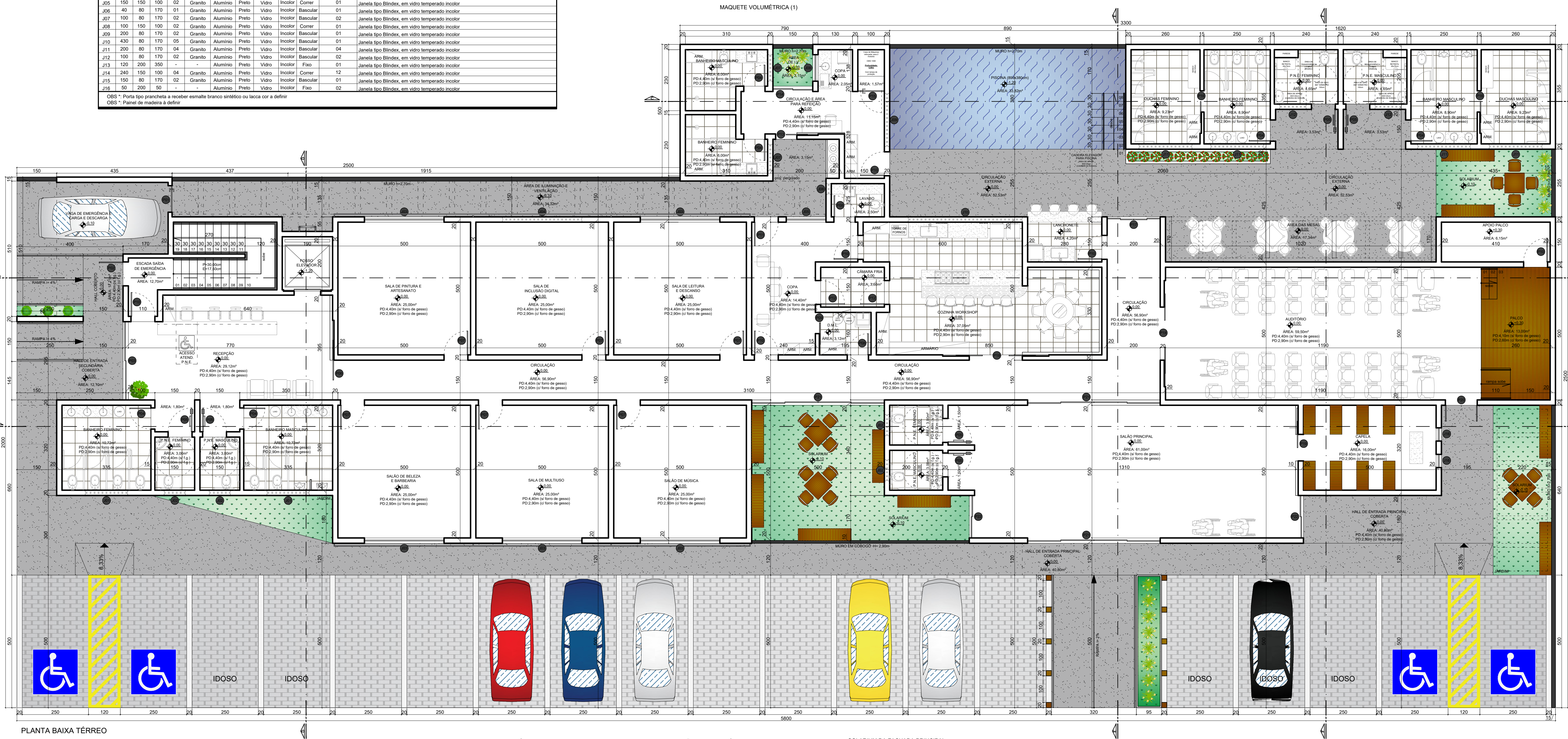
PLANTA BAIXA TÉRREO