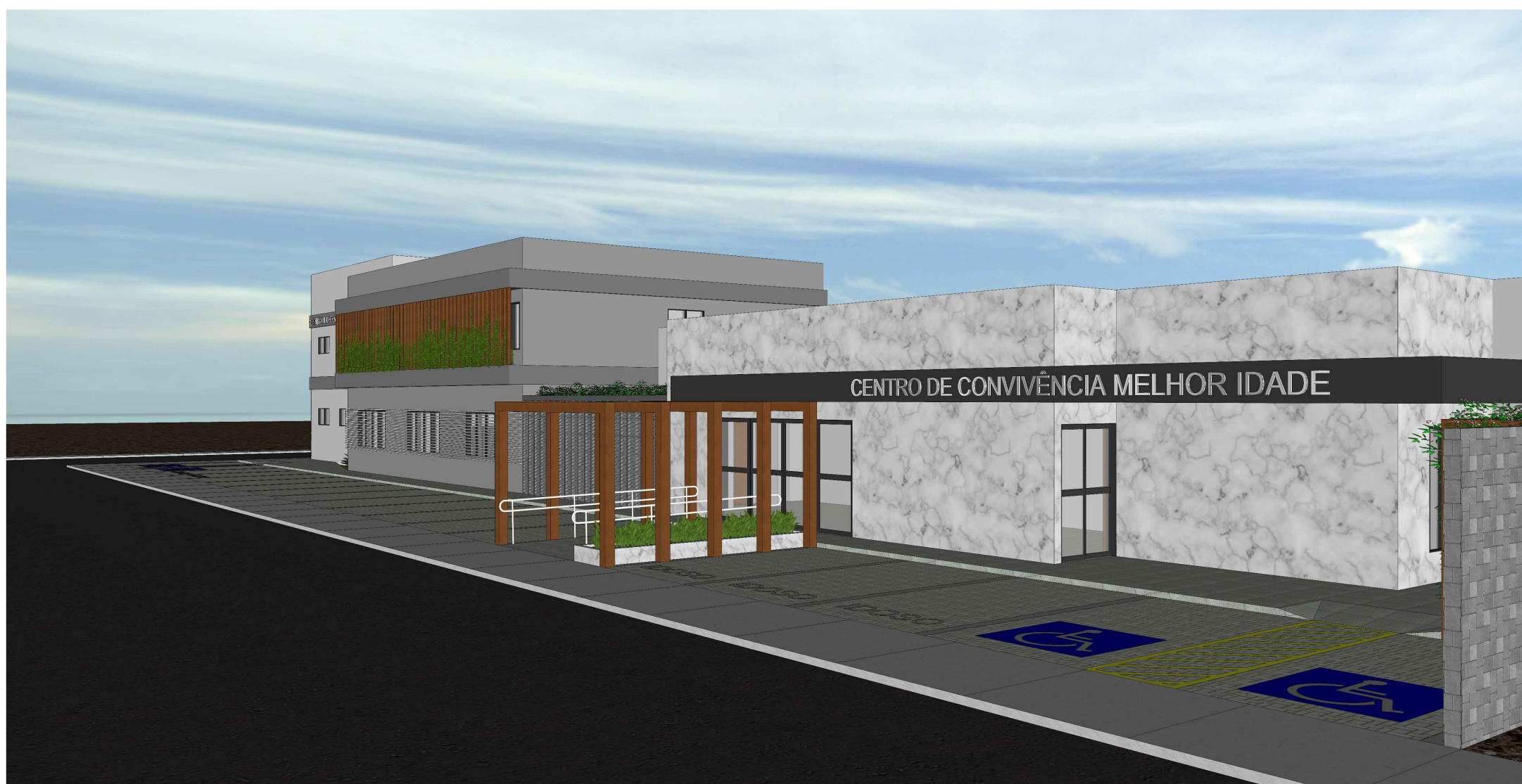
MAQUETE VOLUMÉTRICA (1)

OBS *: Porta tipo prancheta a receber esmalte branco sintético ou lacca cor a definir OBS *: Painel de madeira a definir