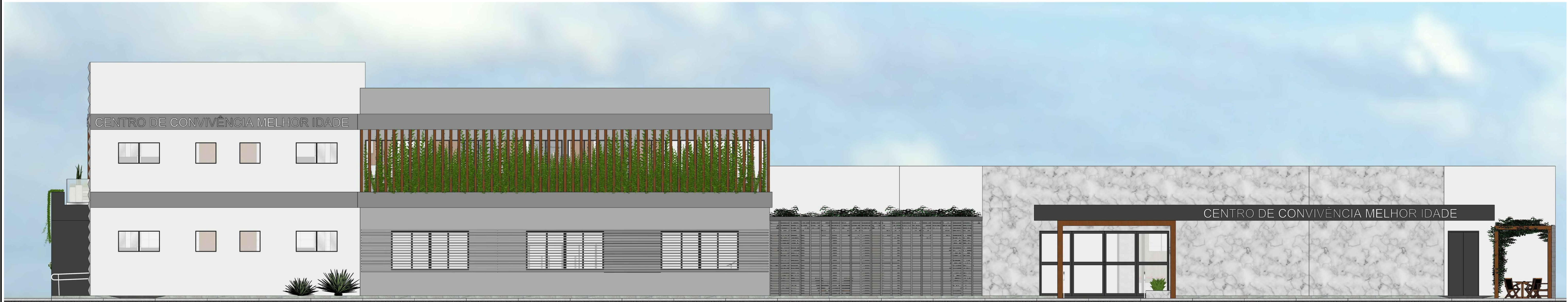
FACHADA FRONTAL - PRINCIPAL (IMAGEM 3D) ESCALA: 1/75