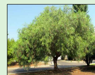
AROEIRA SALSA Schinus Molle