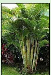
ARECA DE BAMBU Dypsis Lutescens