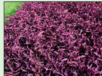
TRAPOERABA-ROXA Tradescantia Pallida Purpurea