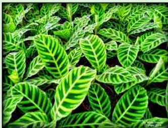
CALATÉIA ZEBRA Calathea zebrina