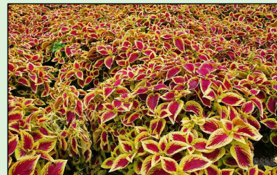
CORAÇÃO MAGOADO Iresine Herbstii