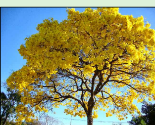
IPÊ AMARELO Handroanthus albus