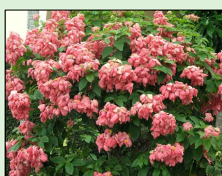
MUSSAENDA ROSA Mussaenda alicia