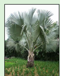
PALMEIRA AZUL Bismarckia nobilis