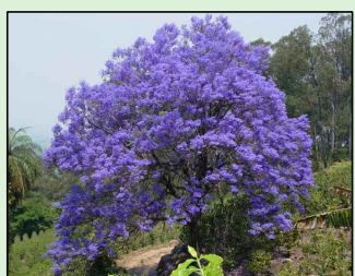
JACARANDÁ Jacaranda mimosifolia