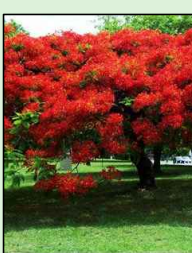
FLAMBOYANT Delonix regia