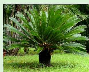
SAGU DE JARDIM Cycas Revoluta