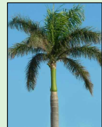
PALMEIRA IMPERIAL Roystonea oleracea