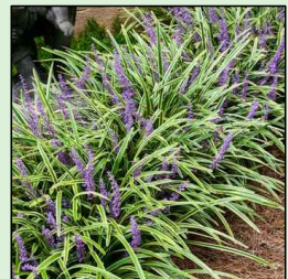
LIRIOPE Liriope spicata