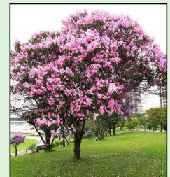
QUARESMEIRA ROSA Tibouchina granulosa