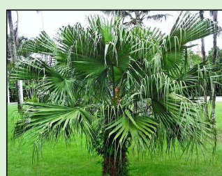
PALMEIRA DE LEQUE DA CHINA Latania chinensis