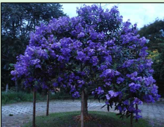
QUARESMEIRA AZUL Tibouchina granulosa