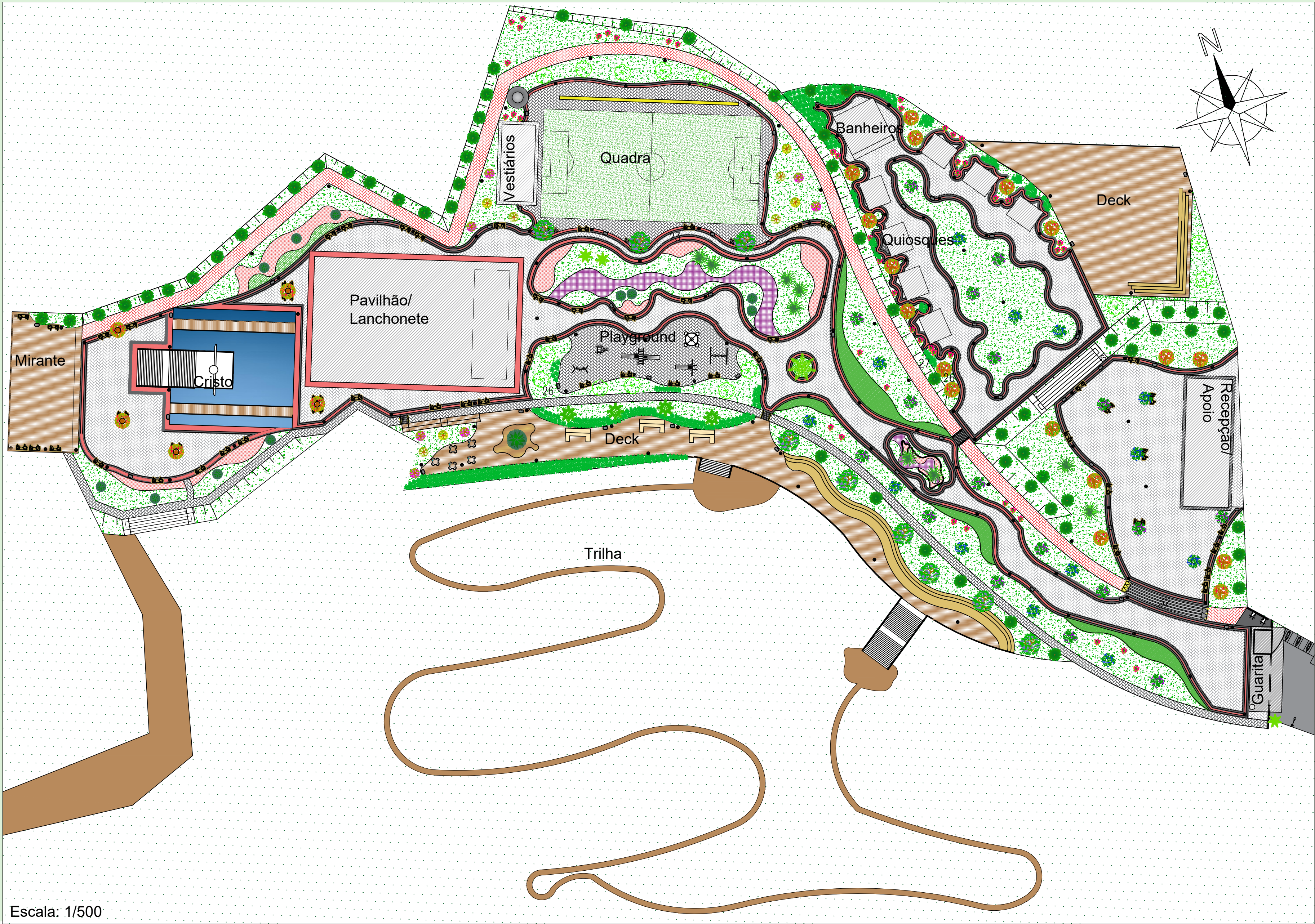
Escala: 1/500