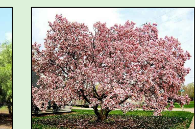
MAGNÓLIA ÁRVORE Magnolia liliflora