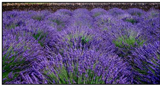
LAVANDA ( Lavandula angustifolia ) Escolhida principalmente devido ao seu aroma com propriedades calmantes, que auxilia no controle do extresse e ansiedade, além de sua bela floração.