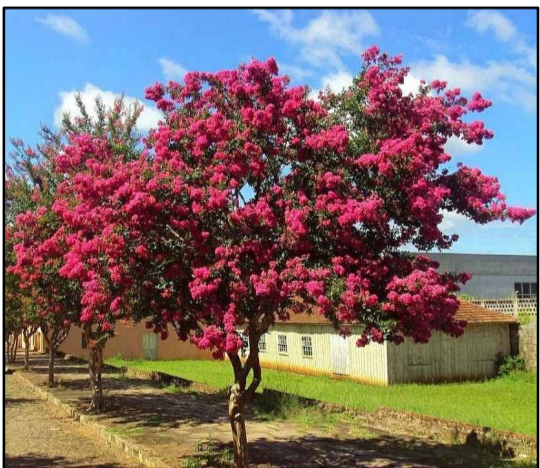
RESEDÁ ( Lagerstroemia indica ) Escolhida pela sua bela floração e principalmente pelo seu pequeno porte, sendo colocada nos caminhos próximos aos canis.