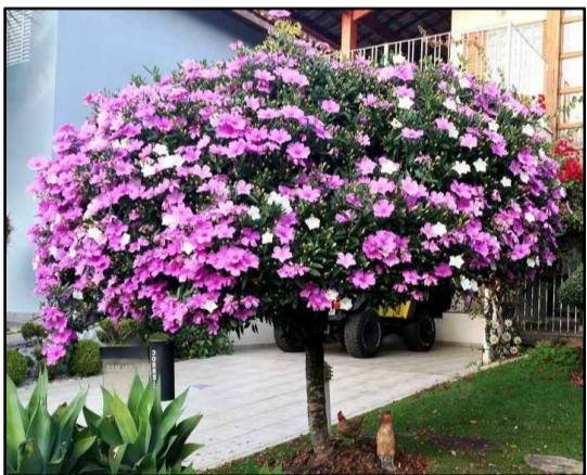
MANACÁ-DA-SERRA ( Tibouchina mutabilis ) Escolhida devido a sua bela floração, recebendo lugar de destaque na praça de eventos e nos caminhos principais.