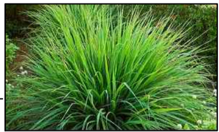
CITRONELA ( Cymbopogon winterianus ) Escolhida pelas suas propriedades repelentes, foi colocada nos canteiros próximos aos canis para o controle de insetos e bactérias.