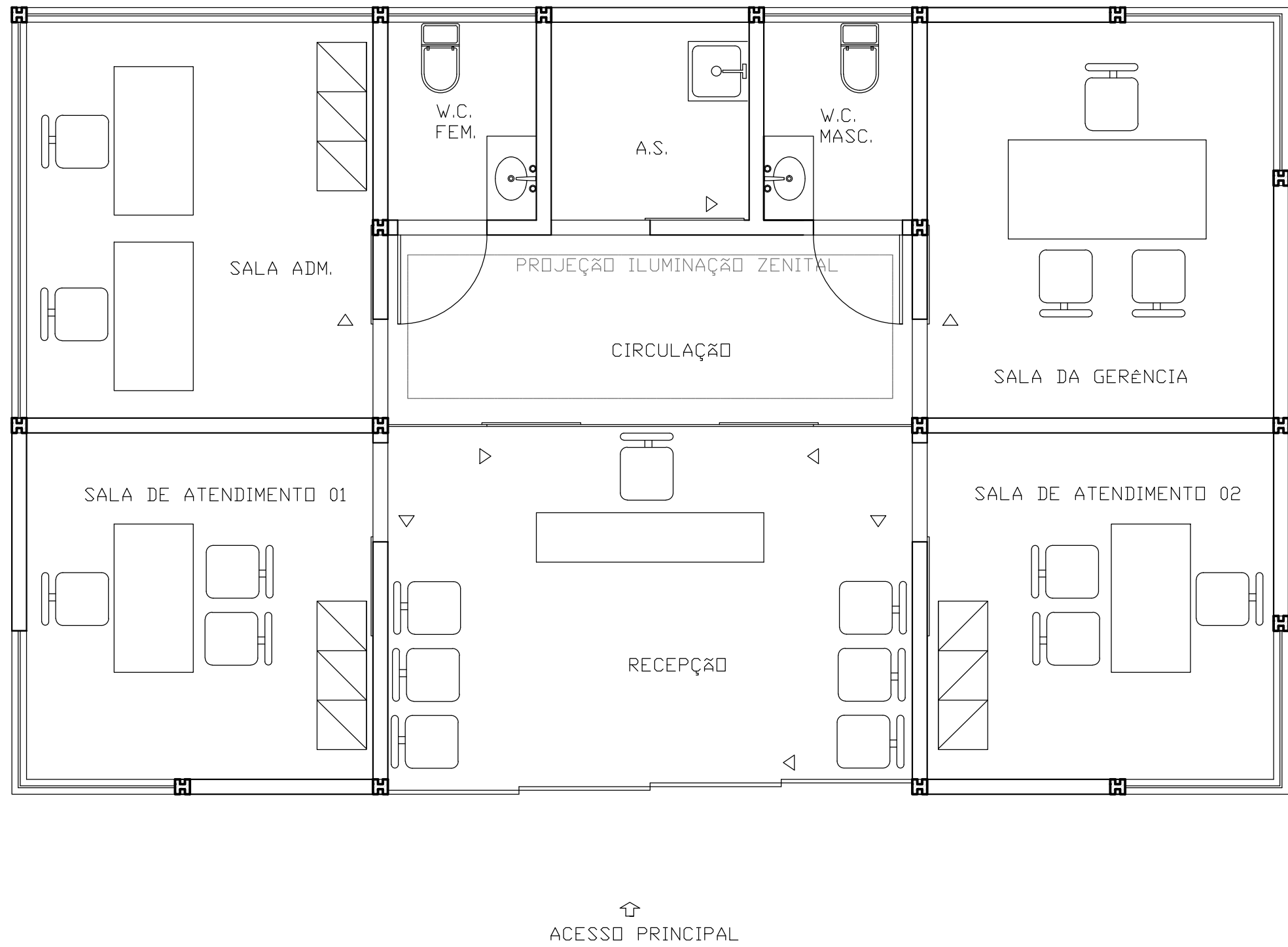
PLANTA BAIXA DO BLOCO ADM. ESC.....1/50

O bloco administrativo foi projetado para proporcionar o máximo de conforto e bem estar aos funcionários e clientes. A estratégia é passar boas sensações através da forte presença de cores claras, iluminação e ventilação natural. Os clientes que usarem esse bloco estarão muito sensíveis, pois estarão tratando de assuntos referentes a óbitos, e os funcionários da administração, por trabalharem com números e tomarem decisões o tempo todo, precisam de um ambiente agradável que ajude com que fiquem menos estressados no decorrer no dia.